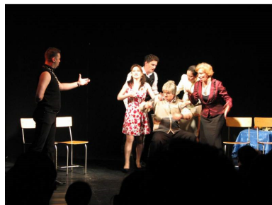
Scenă din „Căsătoria secretă” (Iași))